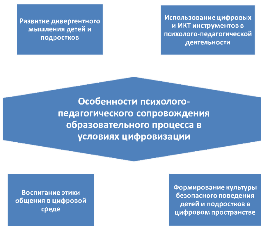
Рис. 1.3.1. Особенности психолого-педагогического сопровождения образовательного процесса в условиях цифровизации

В ОПОП учтены особенности психолого-педагогического сопровождения образовательного процесса в условиях цифровизации (рис.1.3.1.)