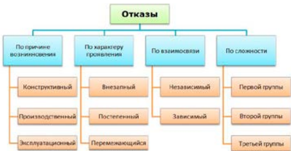
Рис. 1. Классификация отказов

Для наглядности приведем классификацию отказов по основным признакам (рис. 1).