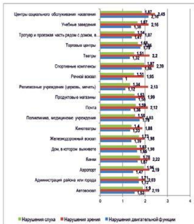
Рис. 1. Оценка приспособленности учреждений / объектов для инвалидов по 5-балльной шкале (в баллах от 0 до 4 включительно, где 0 – «совершенно не приспособлены», 4 – «полностью приспособлены», средний балл)

Министерством труда, занятости и социальной защиты Республики Татарстан проводится регулярный мониторинг изменений, происходящих с момента начала широкомасштабных работ по формированию доступной среды.