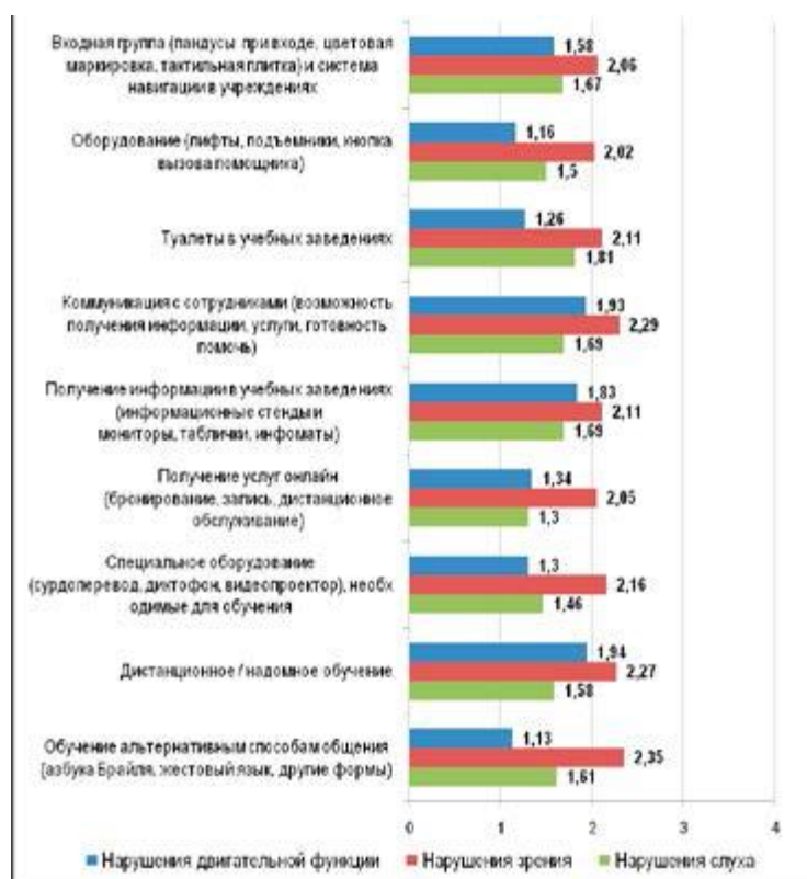
Рис. 2. Слагаемые доступности в сфере образования (в баллах от 0 до 4 включительно, где 0 – «совершенно недоступно», 4 – «более чем доступно», средний балл)

Респонденты исследования в качестве наиболее удобных для инвалидов сфер обозначили сферы социальной защиты (43,5%) и физической культуры /спорта (22,2%). Меньшая доля опрошенных в 2014 г. отметила сферы здравоохранения (18,3%), транспорта (16,9%) и информации и связи (16,4%). Мало кто из опрошенных заявил об удобстве сфер жилого фонда (11,1%), образования (6,0%) и культуры (3,9%).