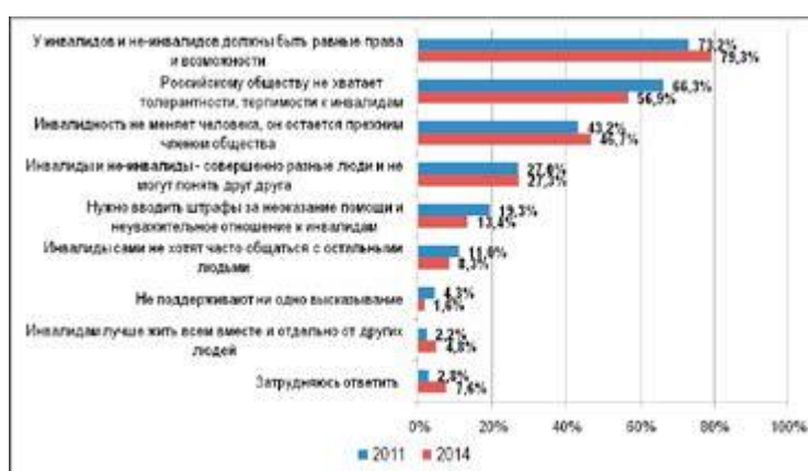
Рис. 4. Результаты опроса мнений участников по поддержанию интеграции инвалидов в общество

Общество, по мнению абсолютного большинства опрошенных в исследовании 2014 г., в целом не готово к интеграции инвалидов. Так, отвечая на вопрос: «В какой мере общество готово к интеграции инвалидов?», четверть участников исследования (35,0%) выбрали вариант ответа: «В целом готово», а более двух третей (59,5%) – «В целом неготово». О неготовности общества к интеграции инвалидов заявляло и большинство участников опроса 2011 г., хотя тогда доля подобных респондентов составила 72,0%.